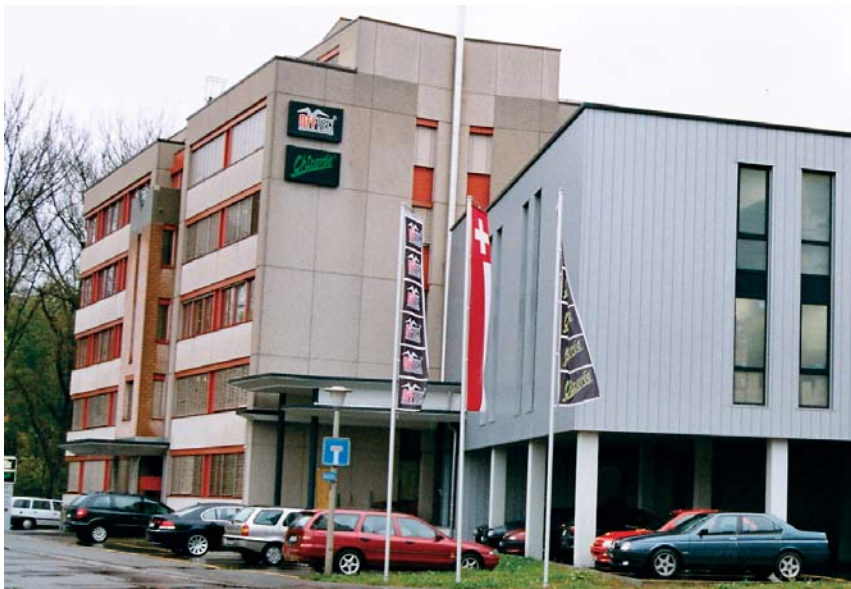
Hauptsitz Chicorée-Mode an der Kanalstrasse im Dietiker Industriegebiet.

zieren, sodass sich Weber fast ausschliesslich um strategische Aufgaben kümmern kann.